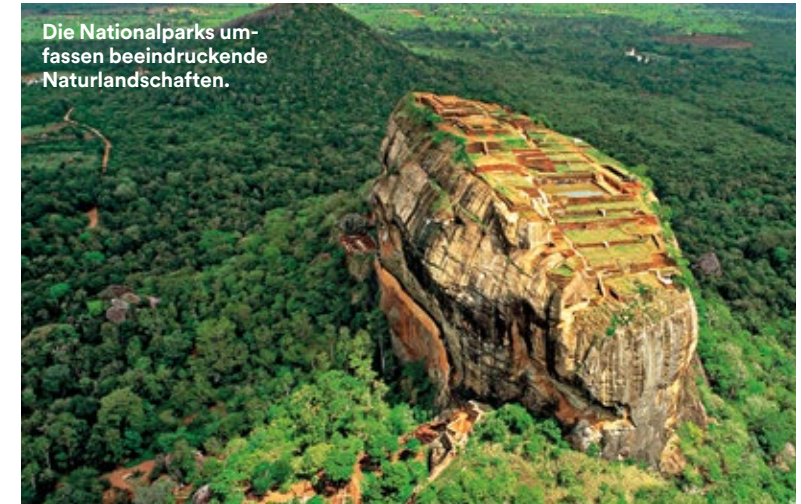
Die Nationalparks umfassen beeindruckende Naturlandschaften.