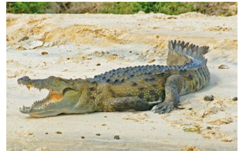
Ein Krokodil beim Sonnenbad.

Insbesondere die nahe gelegenen und weltberühmten Wilpattu- und Minneriya-Nationalparks bieten beste Voraussetzungen für ausgedehnte und intensive Tierbeobachtungen und atemberaubende Fotomotive. Zu den Highlights gehören Begegnungen mit den seltenen Sri-Lanka-Leoparden, den Sri-Lanka-Faultieren, Büffeln sowie Sambar- und Axis-Hirschen. Im Minneriya-Park lebt zudem die größte zusammenhängende Elefantenherde Asiens. Dort existieren überdies zwei endemische Affenarten.